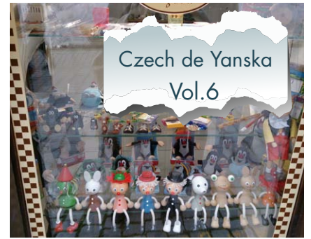
Czech de Yanska Vol.6