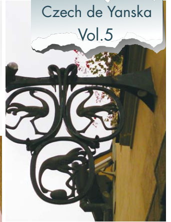
壁からよきによき

建物の横壁から突き出たような看板は、存在感抜群。ここにはチカチカ電飾看板や、蛍光色の旗はありません。